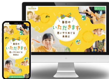
FOOD RIBBON (ロングスプーン協会)