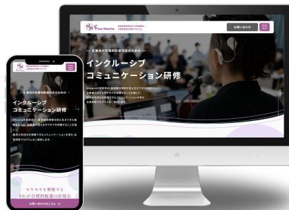
インクルーシブ コミュニケーション研修 (一般社団法人 4Hearts)