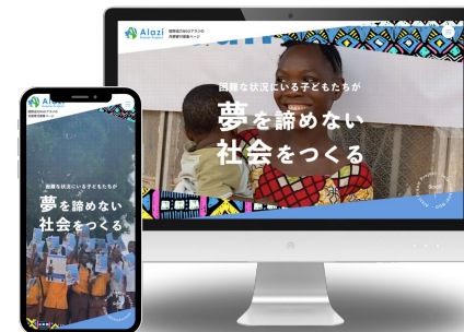
特定非営利活動法人 Alazi Dream Project